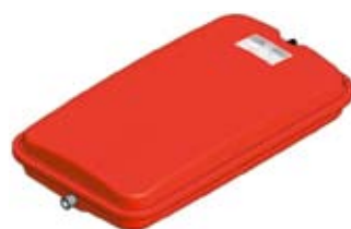
Disegno / Drawing 539/L