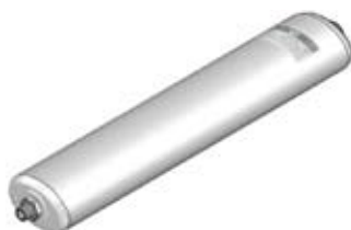
Disegno / Drawing 564