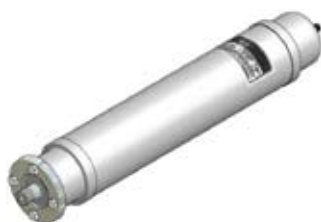
Disegno / Drawing 564/F