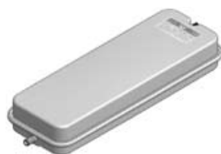
Disegno / Drawing 537/XL