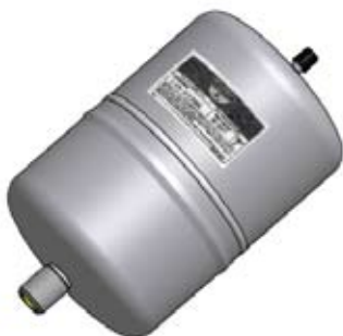
Disegno / Drawing 20016