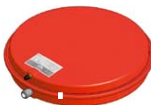
Disegno / Drawing 521/L