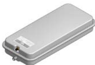
Disegno / Drawing 518