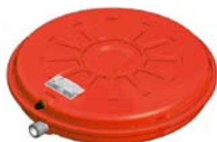
Disegno / Drawing 531/L