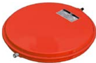
Disegno / Drawing 522/L