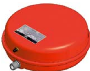
Disegno / Drawing 541/L