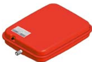
Disegno / Drawing P637/L