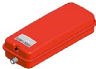
Disegno / Drawing 537/L