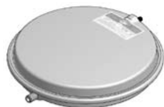
Disegno / Drawing 533